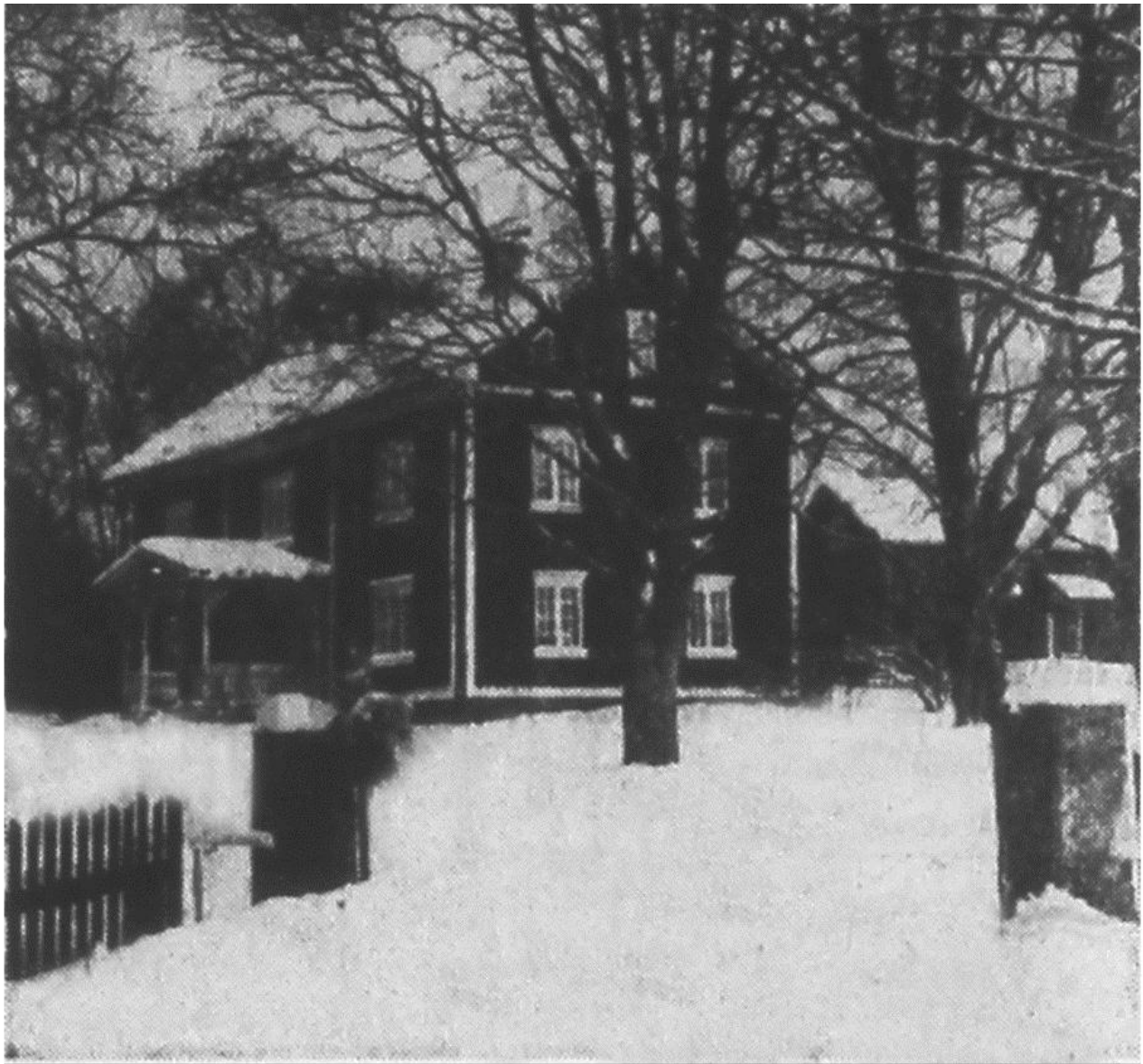
Gården Tomta i Arbotten är typen för en gammal vacker värmlandsgård.

grunden. Fastigheten hade inköpts av Billerudsbolaget, men då detta inte kunde få lagfart på egendomen gick köpet tillbaka. Engströms far, Oskar Engström, kom hit 1922 som arrendator och blev sedermera ägare till gården.