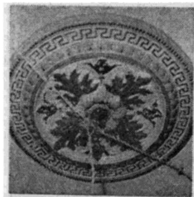
Under denna takutsmyckning, som skall restaureras hängde kristallkronan under Ehrencrona-tiden.