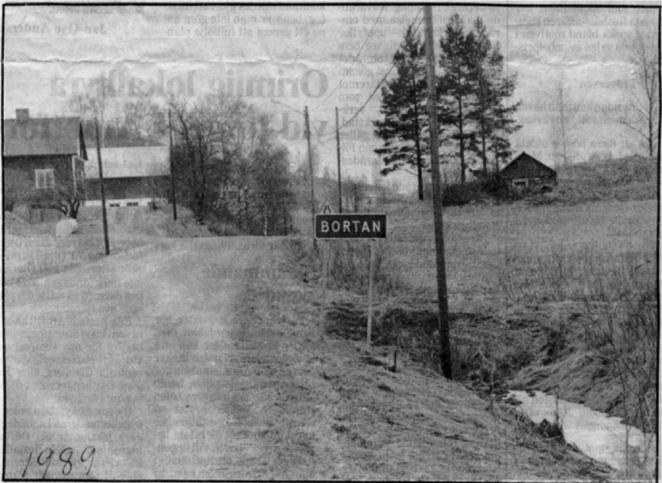
Hemmanet Bortan i norra Gunnarskog är inte den avfolkningsbygd som många tror för här finns i dag nästan 30 barn som inte börjat skolan.