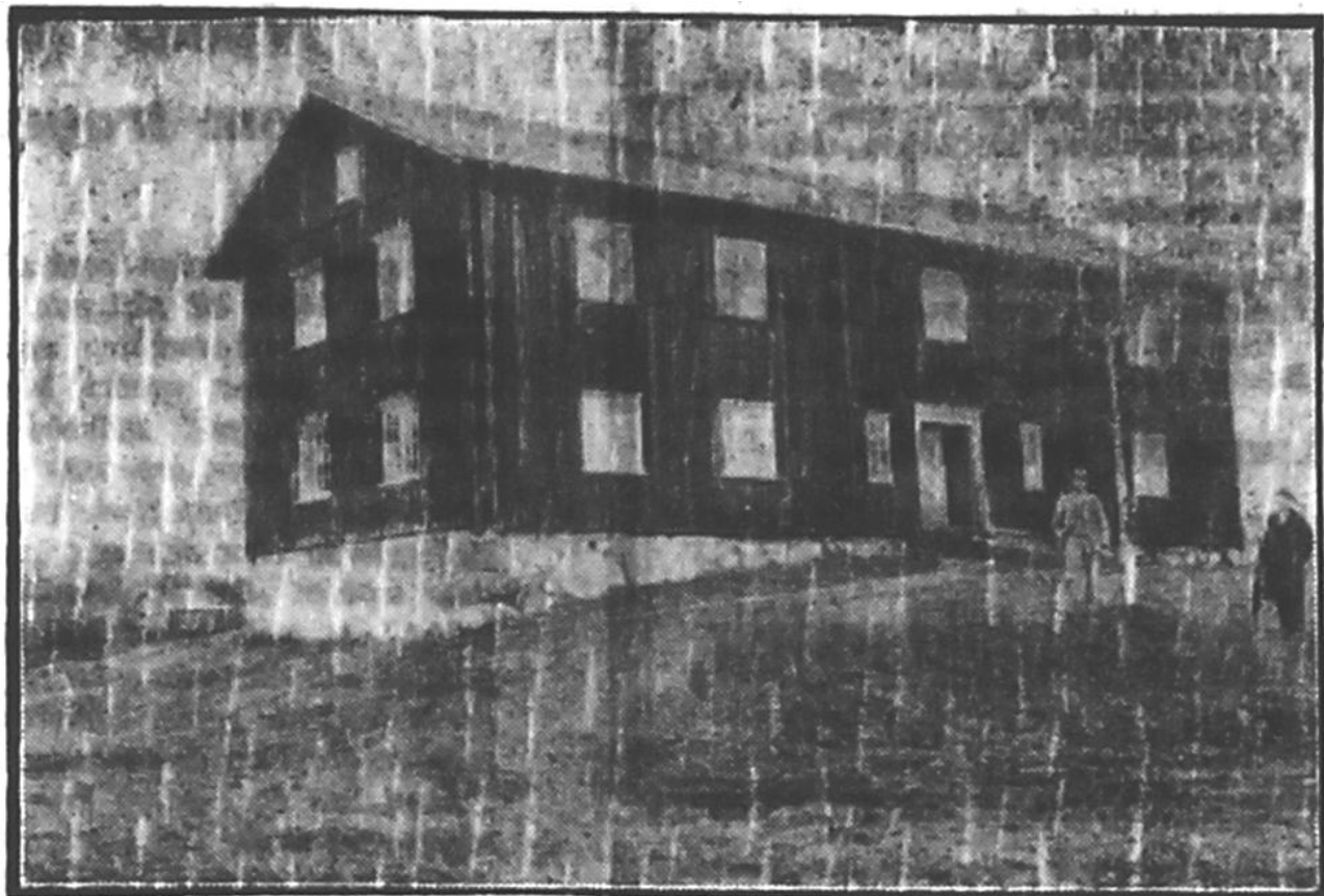
SITTSTUGA I BORTAN.

stodo av långa stänger, och sedan fortsatte likfärden med båt genom sjöarna Vassbotten och Bergsjön. Stället kallades Kyrkhögen och vägen, som ledde dit, Finnevägen. Ända till för en 30 å 40 år sedan kunde man se högen av bårar vid vägen. Säkert ansågs det farligt att borttaga dessa likbårar. Finnevägen går ännu från Bortan över Ekhöjden och Rödberget till Bogen.