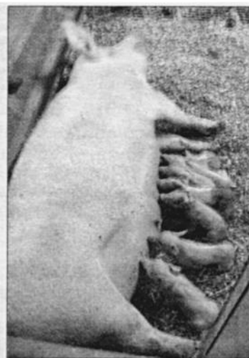
SMÅKULTINGAR. Efter utökningen kommer årligen cirka 10,000 kultingar att födas i Sälboda. De diande småttingarna är fem dagar.

ören extra per kilo samtidigt som Konsum kan garantera att råvaran kommer från länet. Det är roligt att föreningen vill ta på sig detta lokala ansvar, säger Jörgen Blakstad och tillägger att man levererat över 200 000 grisar på en bit över hundra kilo sedan starten 1960.