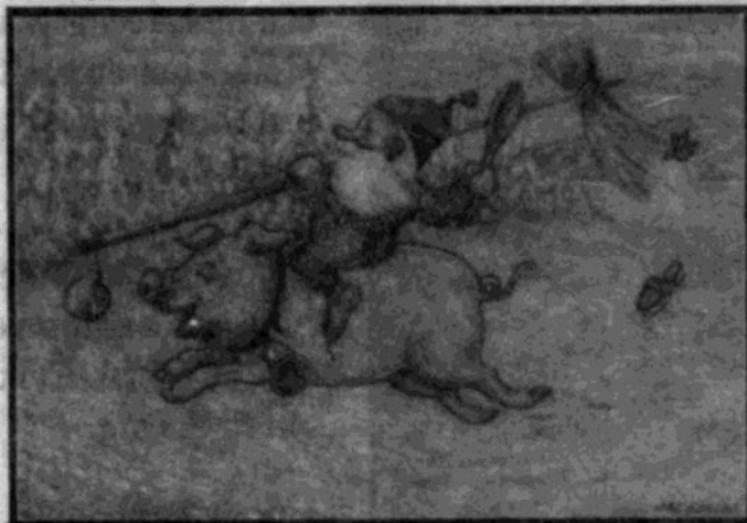
Ett julkort signerat Jace Edgren.

Han samlade istället på allmän-giltiga typer som kunde betraktas som oförargliga just genom sin anonymitet.