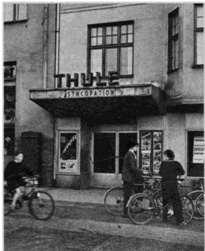
Bion nr 2 heter Thule och ligger på Råsundavägen 31 i Hagalund. Den räknas nog inte till de mera tongivande.