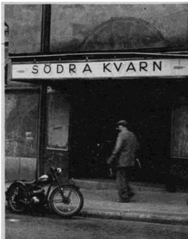
Bion nr 3 heter Södra Kvarn — ej att förväxla med Röda Kvarn! — och ligger på Skånegatan 87.

Men det gick inte över. Dirren blev i stället så nere och så visnen att han varken ville se eller prata med folk och under inga förhållanden svara på några obehagligt närgångna frågor. Det fick frun klara av. Att kratsa kastanjer ur elden är inget jobb för en karl.