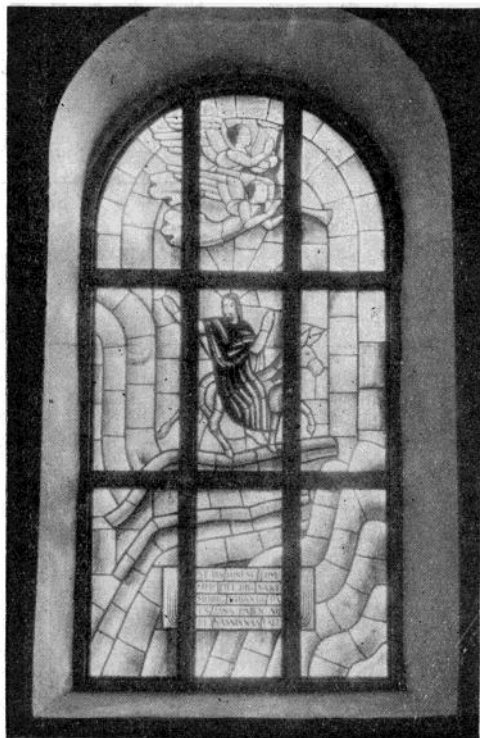
»Din Konung kommer till dig!» Ett av de nya korfönstren.

och agnar i mjölet. I de åren tog man i Gunnarskog i tu med att utvidga kyrkan. Gör det efter nu den som kan. Korskyrkan var färdig 1783. I början av 1800-talet visade tornet benägenhet att skilja sig från den övriga delen av kyrkan och efter flera misslyckade reparationer beslöts det