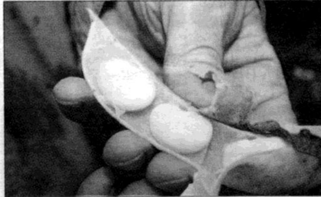
LIMABÖNA. Stora, vita bönor som smakar lite som champinjoner.

PÅ FRAMSIDAN av huset har en stor gräsmatta omvandlats till ett trädgårdsland med odlingsbädd efter odlingsbädd med grönsaker