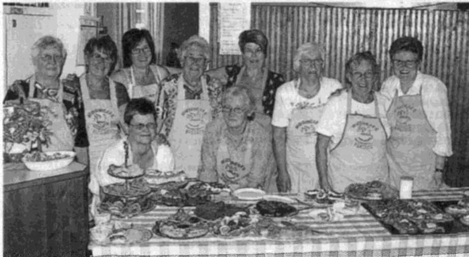
Detta glada gäng kan verkligen intyga att allt kaffebröd verkligen bakas med kärlek och smör!