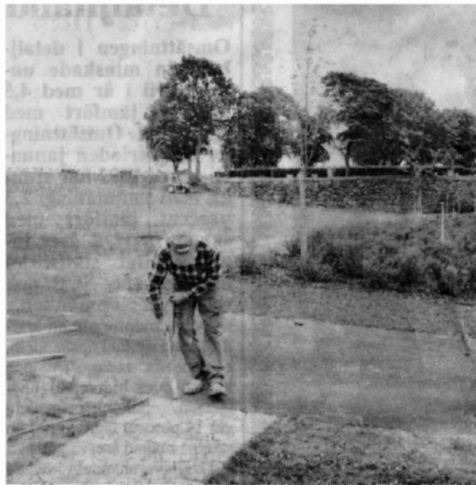
Inga gifter här inte. Ogräs kremas med gasolbrännare.

Den officiella invigningen av kyrkogården blir den 13 september.