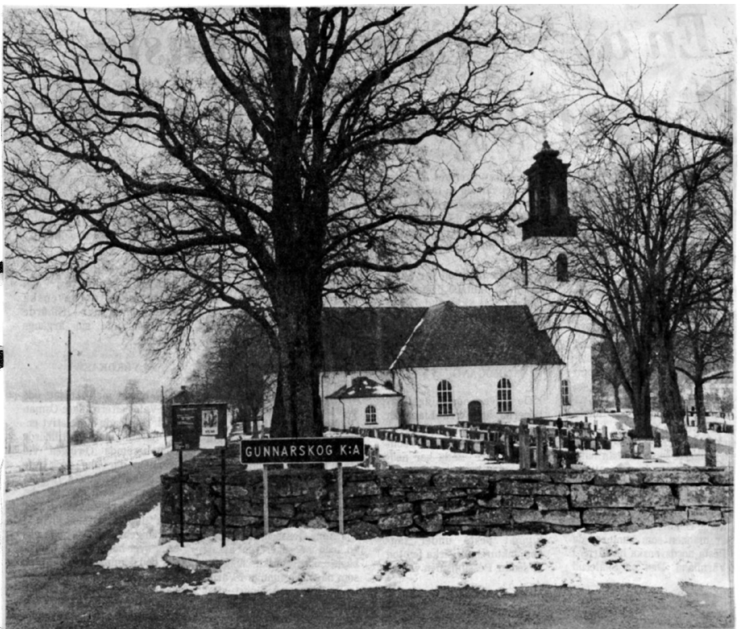
Den vackra kyrkan från 1727 ligger, som sig bör, på den naturskönaste platsen i Gunnarskogs samhälle.

Detta tidningsurklipp och urklippet på nästa sida hör nog inte ihop då det ena är ett vintermotiv och det andra skrivet på höstkanten, men trots detta lade jag dem på samma ställe.